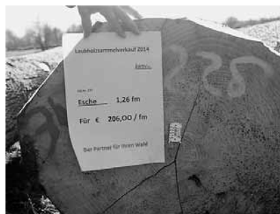
Esche 1,26 fm, 206,00 Euro/fm