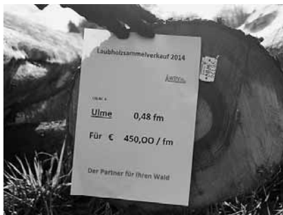
Ulme 0,48 fm, 450,00 Euro/fm