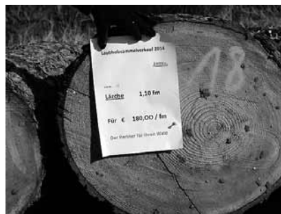
Lärche 1,10 fm, 180,00 Euro/fm

Nahezu 100% der angebotenen Eichenstämme konnten zu guten bis sehr guten Preisen abgegeben werden.