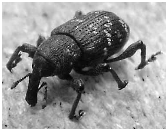
Der große braune Rüsselkäfer

Der Käfer bevorzugt zum Brüten frische Nadelholz Wurzelstöcke. Er legt seine Eier in die frische Rinde der Stöcke. Von dort ausgehend befällt der Käfer insbesondere junge Nadelholzpflanzen und benagt v.a. bodennah die Rinde dieser kleinen Bäume. Hierdurch wird der Saftstrom gestört oder unterbrochen. Dies führt zu