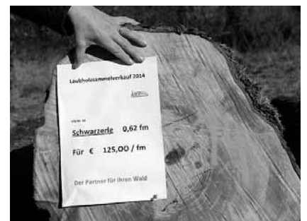
Schwarzerle 0,62 fm, 125,00 Euro/fm

Von 157 Mitgliedern der WBV Rosenheim wurden insgesamt 17 verschiedene Baumarten mit einer Gesamtmenge von 816 fm angeliefert.