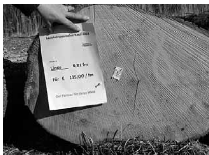
Linde 0,81 fm, 135,00 Euro/fm