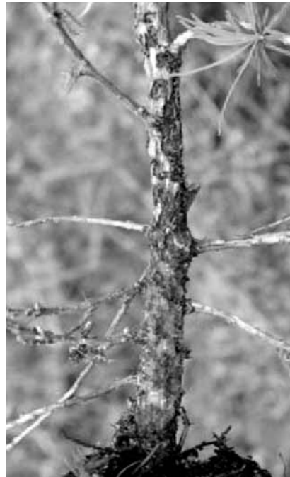
Fraßspuren an einer Jungpflanze

große, trichterförmige Pockennarben die der Käfer durch Rinde und Kambium frißt. Die Fraßspuren reichen von punktuellen bis hin zu flächigen Verletzungen. Ist bereits in einem Jahr ein Befall zu erkennen, muß man im Folgejahr mit weiterem bzw. vermehrtem Auftreten rechnen!